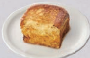
フレンチトースト