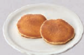
バターミルクパンケーキ2枚