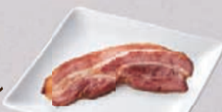
厚切りベーコン1枚